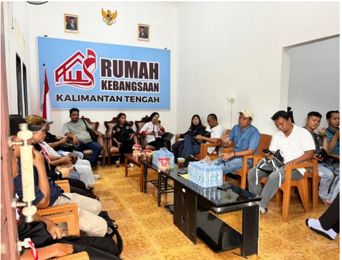
Gambar: Acara Ramah Tamah di Rumah Kebangsaan Kalteng

PALANGKA RAYA - Pelaksanaan pemilihan kepala daerah (Pilkada) yang akan dilaksanakan secara serentak di seluruh wilayah Republik Indonesia, tahun 2024 ini.