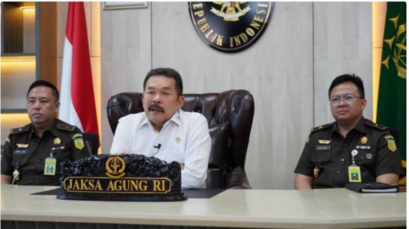
Jaksa Agung, Burhanuddin